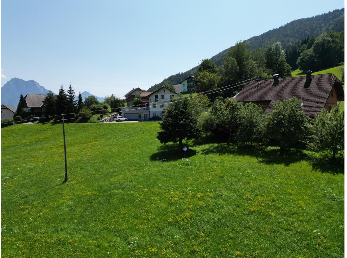
Traunstein im Blick