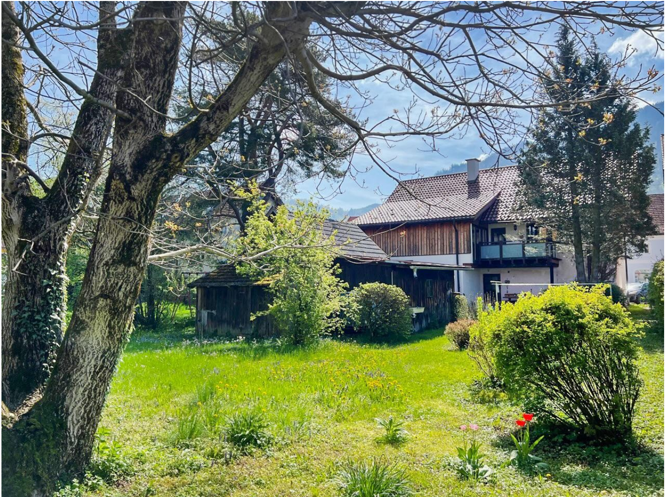
Balkon mit Blick in den eigenen Garten