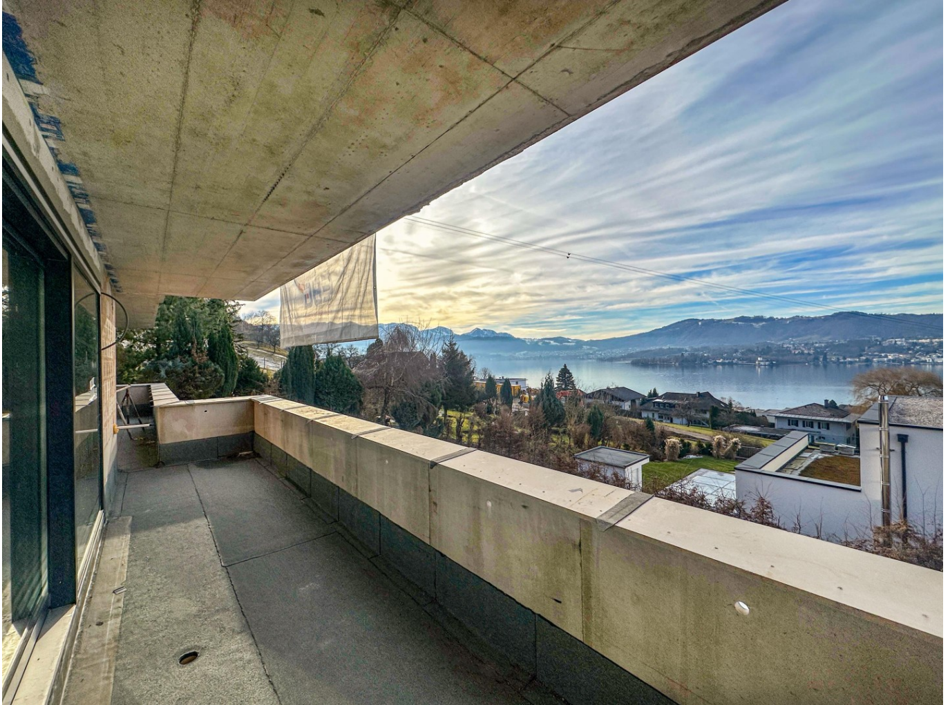
Ausblick von der Terrasse