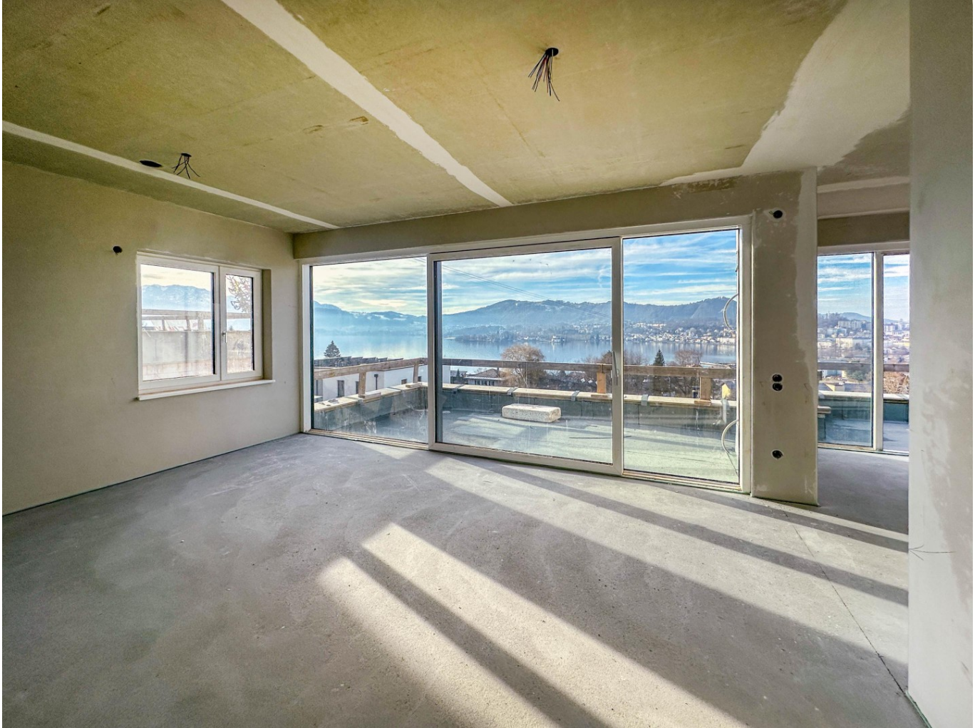
Blick vom Koch-Wohn-Essbereich