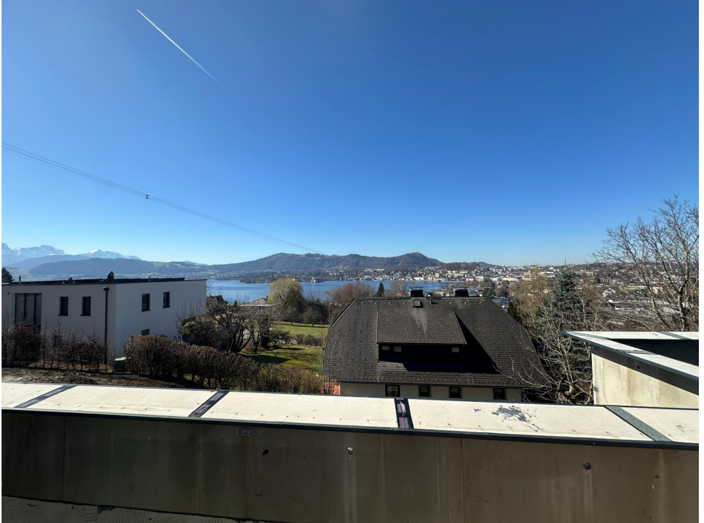
Blick von der Terrasse