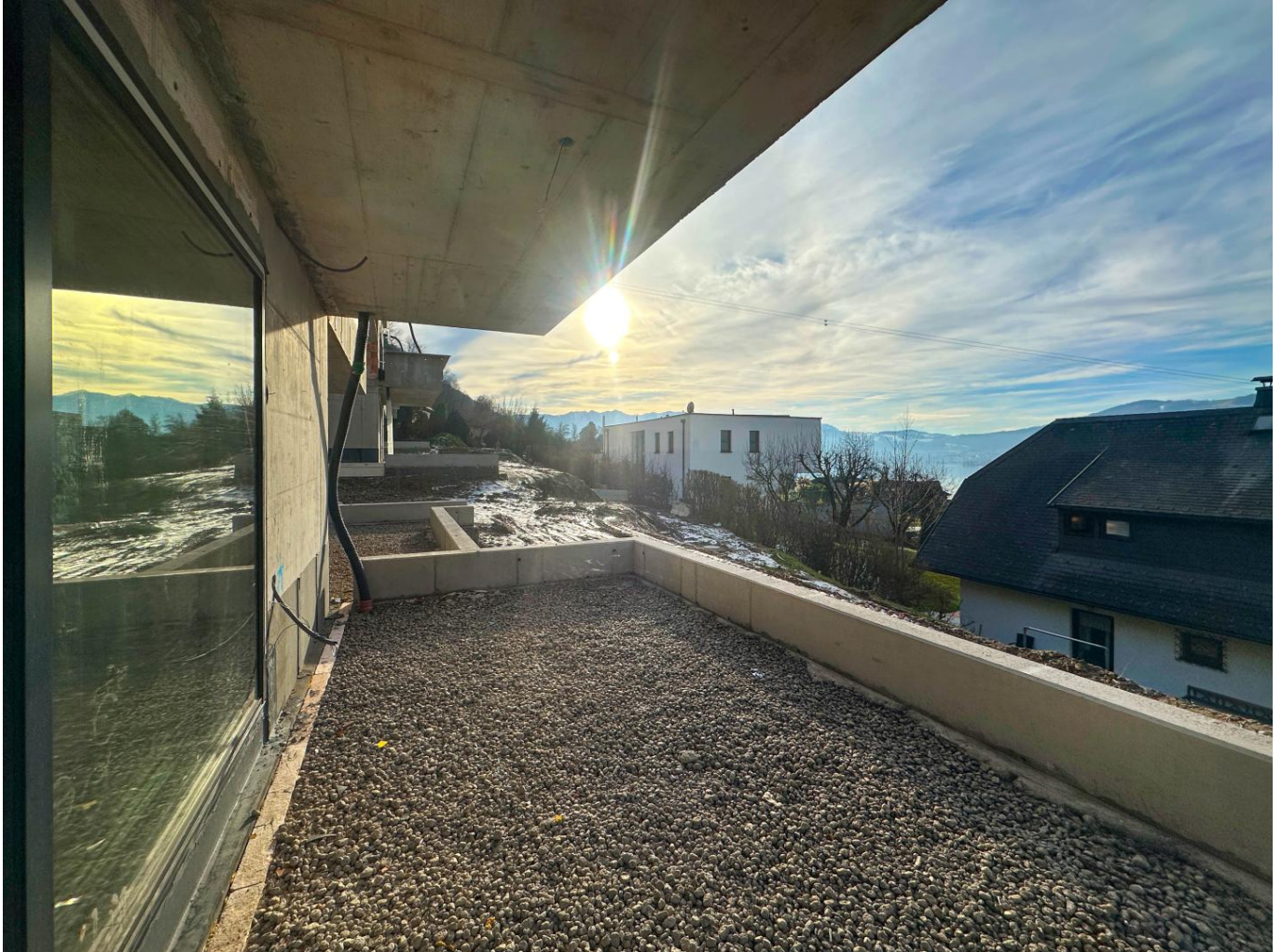
Terrasse mit Ausblick