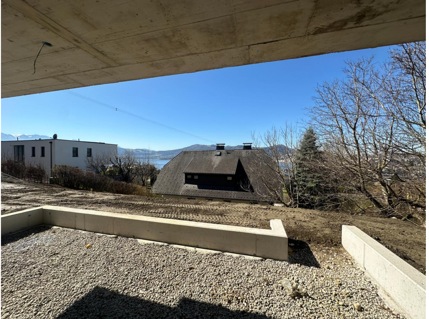
Ausblick von der Terrasse