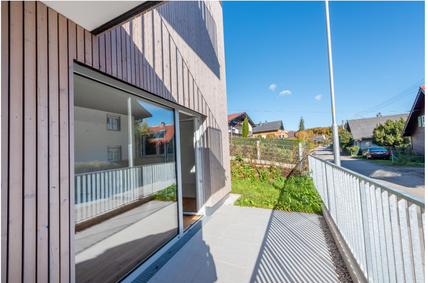
Terrasse und Garten