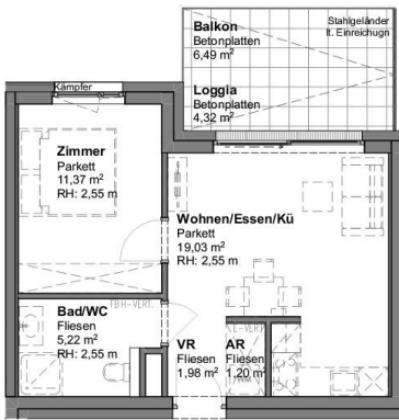
▲ TOP 19 38,80 m 2