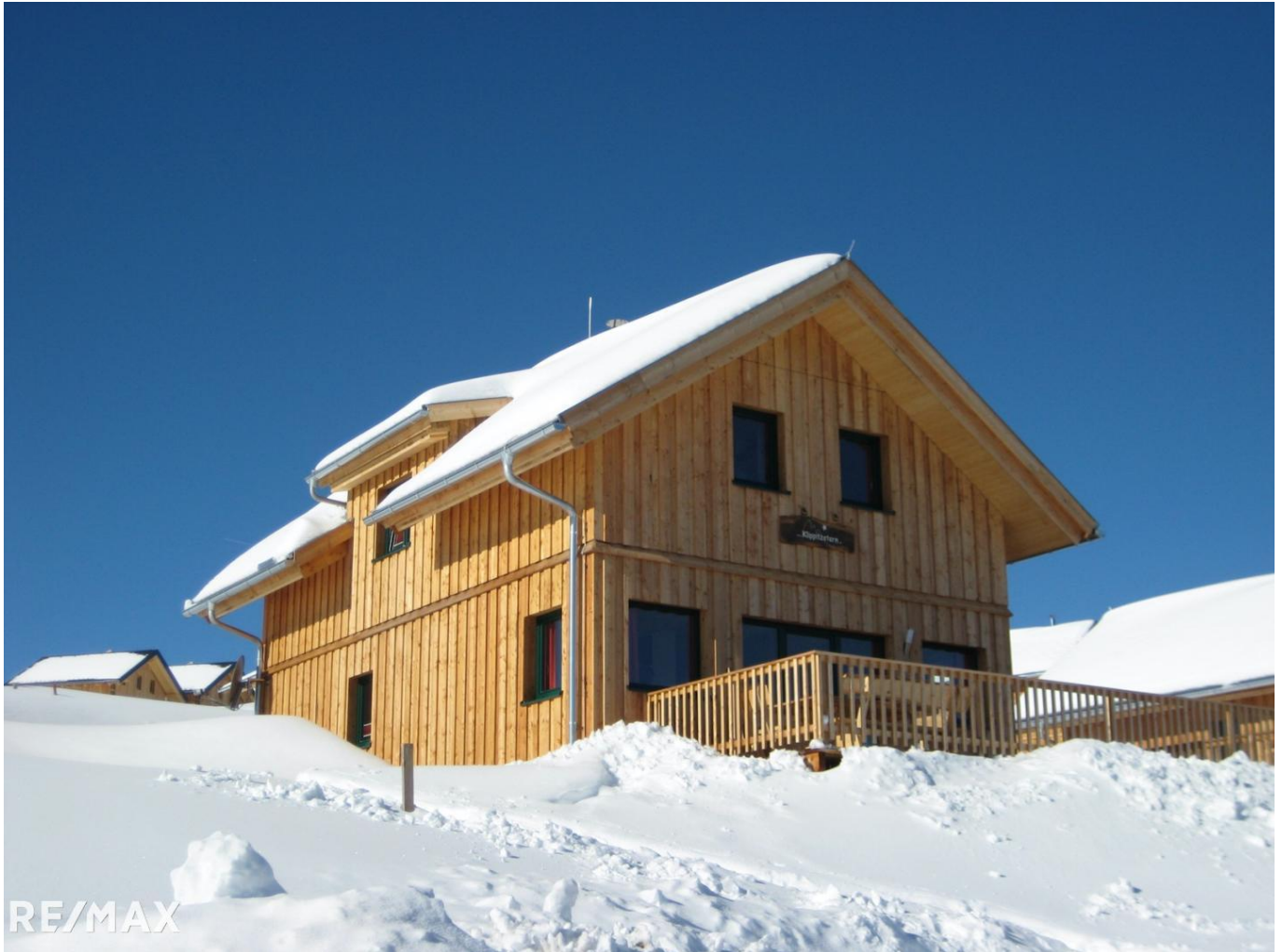
Almchalet im Winter