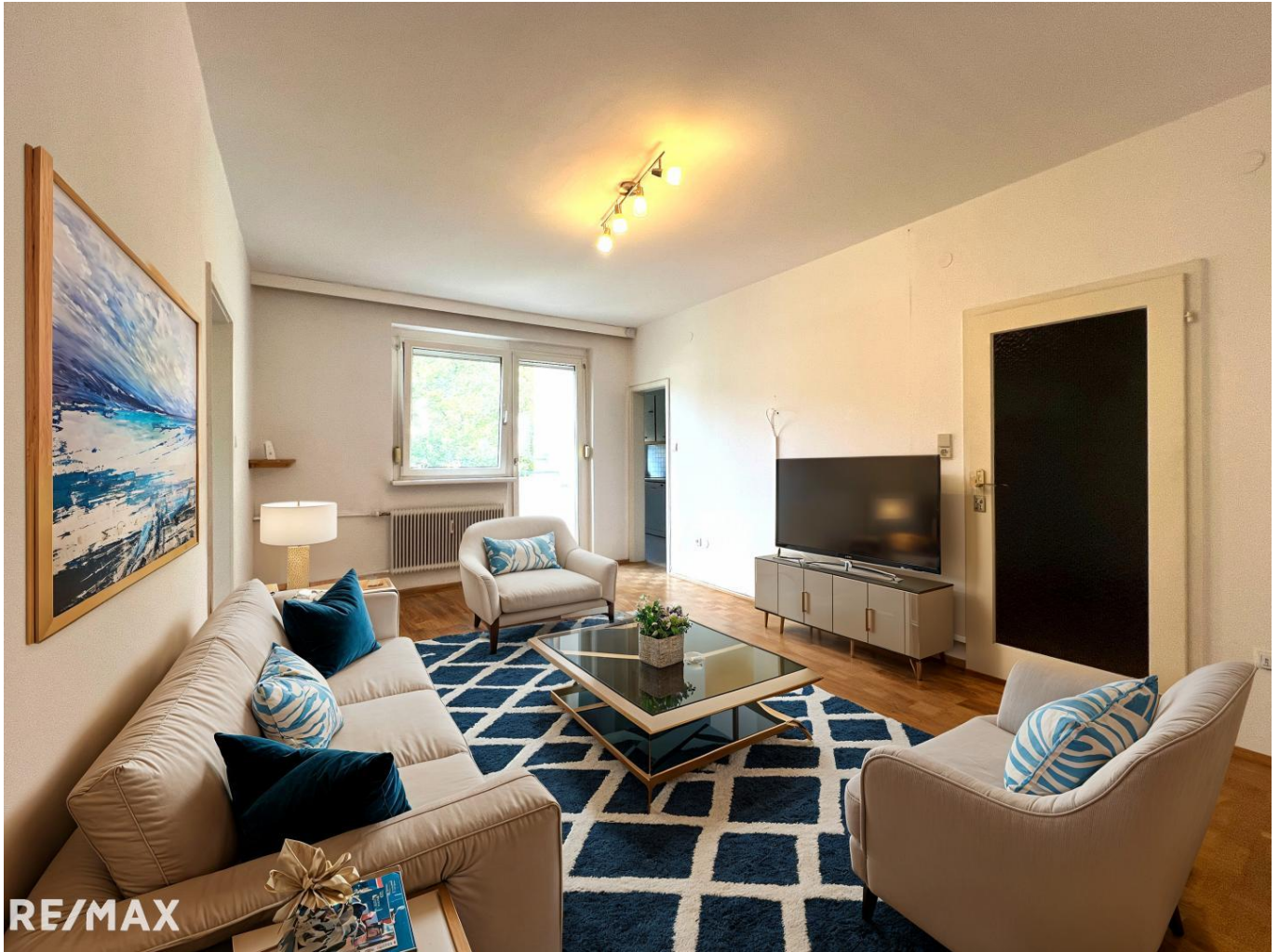
Wohn- und Essbereich (Einrichtungsbeispiel)