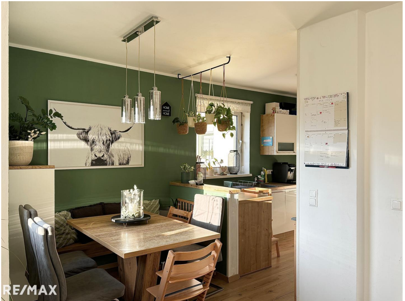
Esszimmer mit Küche