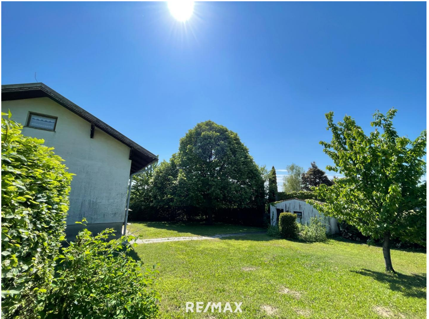
GARTEN - Blickrichtung Osten

Objektnummer: 1609_41665 Eine Immobilie von RE/MAX First