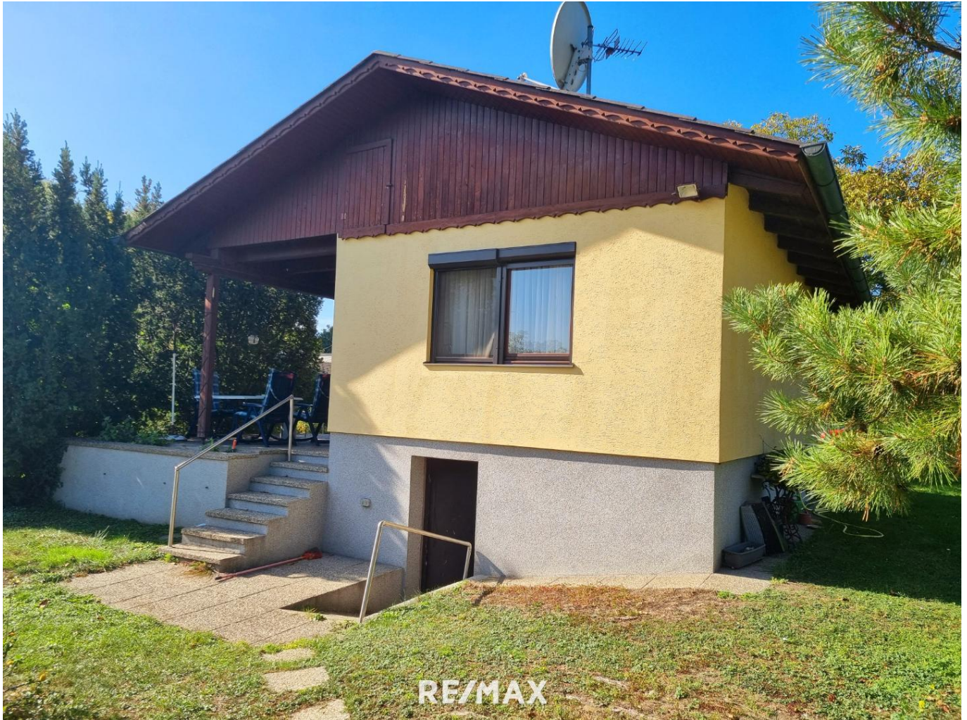
Haus von außen