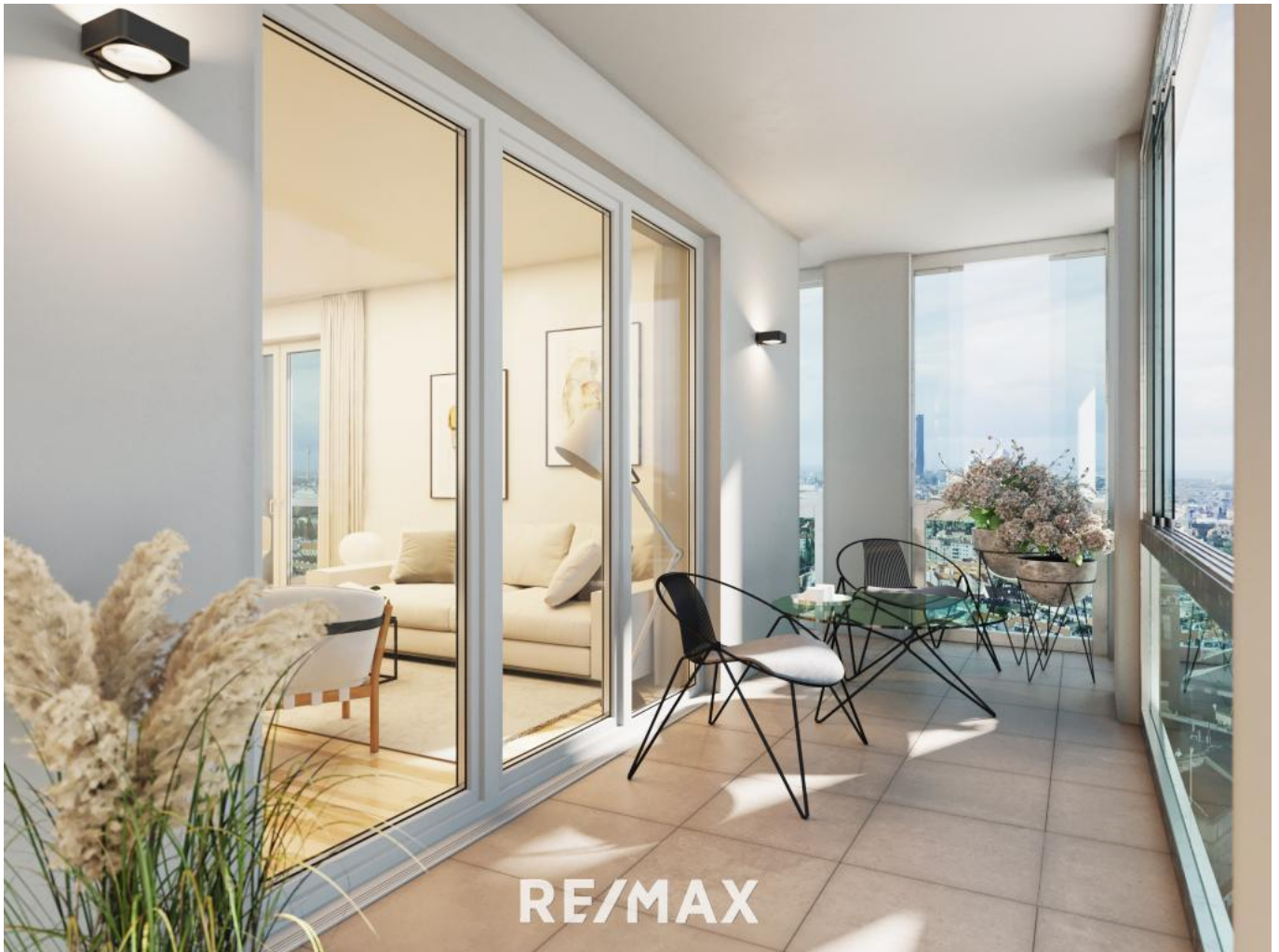
Visualisierung Loggia | Balkon