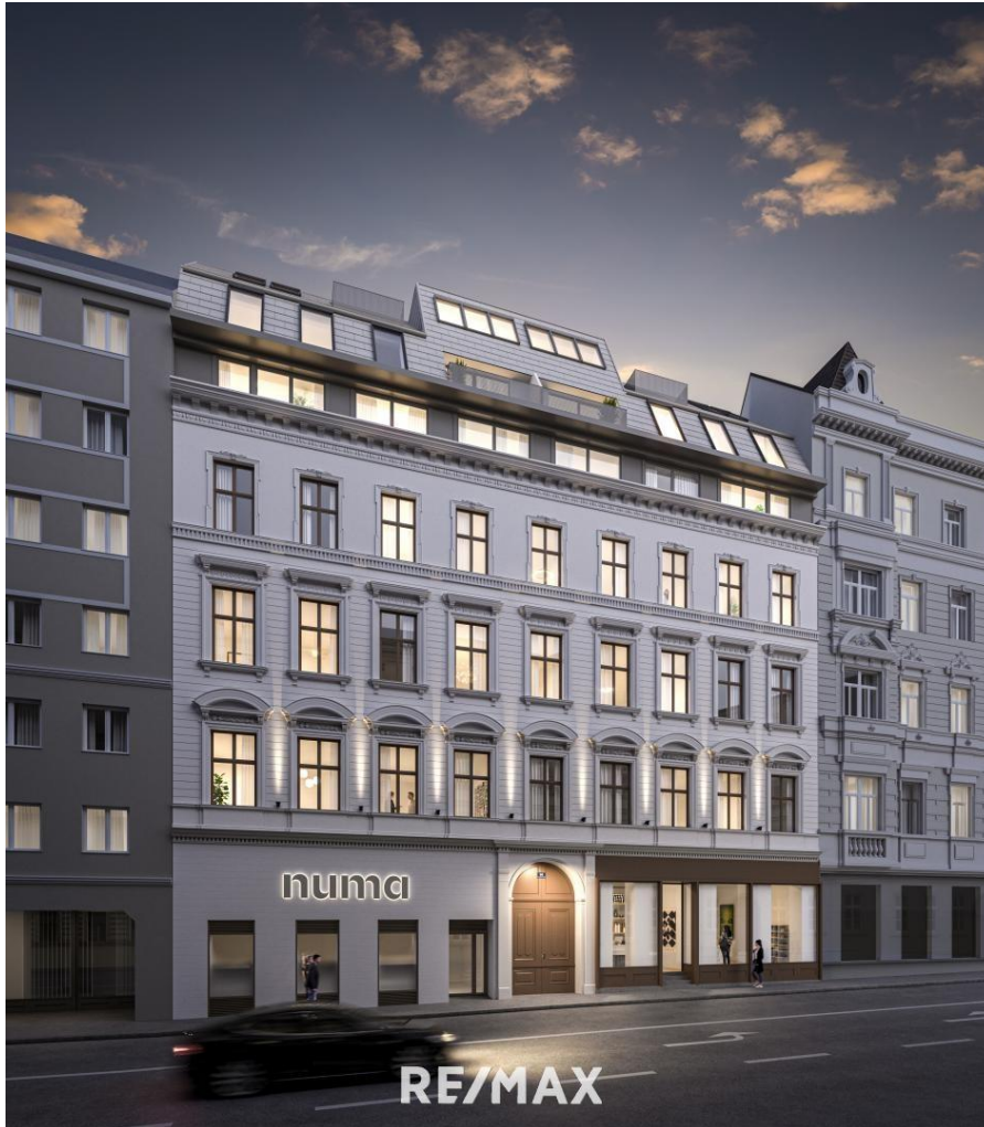
01 Visualisierung Hausansicht