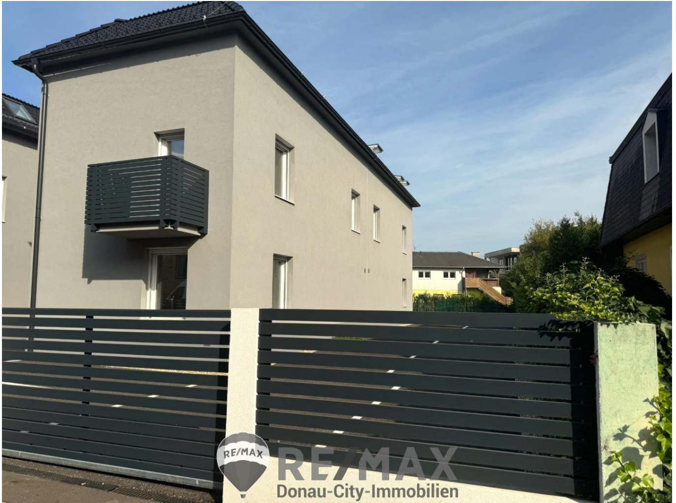
Straßenansicht DHH 1&2