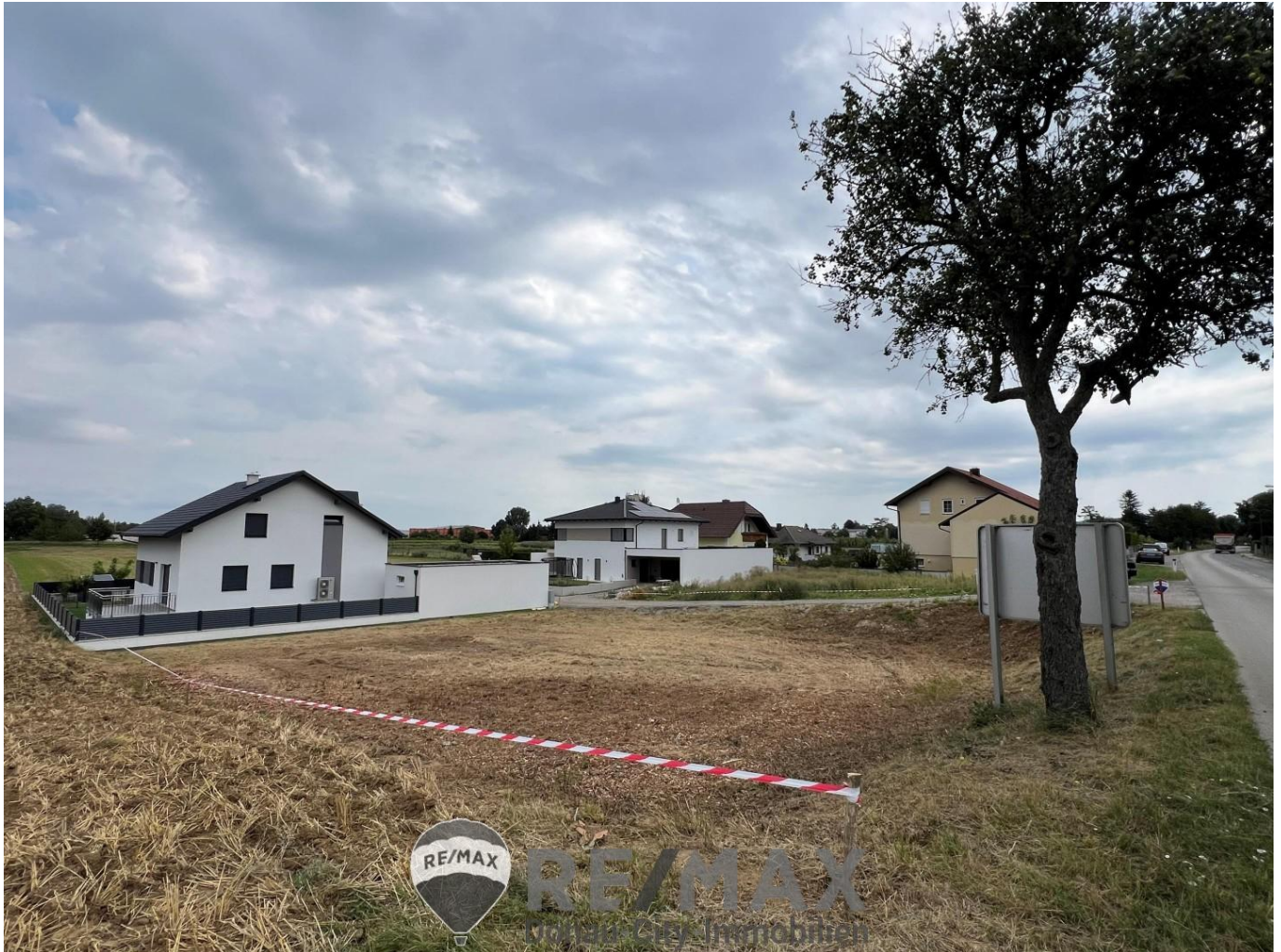
01 Baugrundstück in Judenau