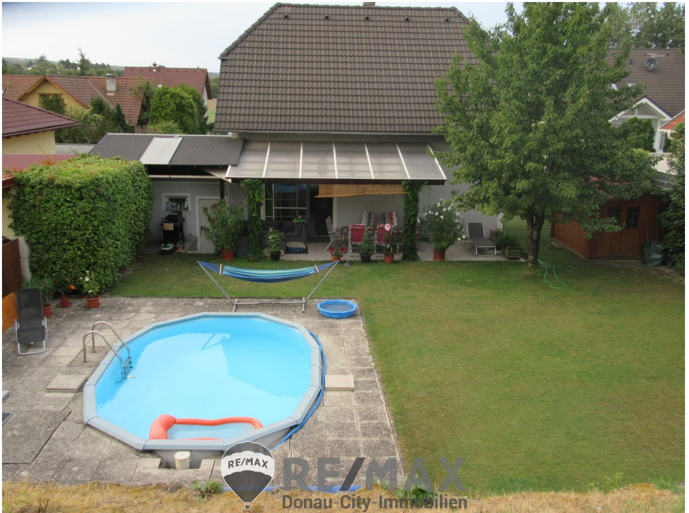
Gartenansicht mit Pool

"Ich weiss, was Du im Sommer tun wirst...!"