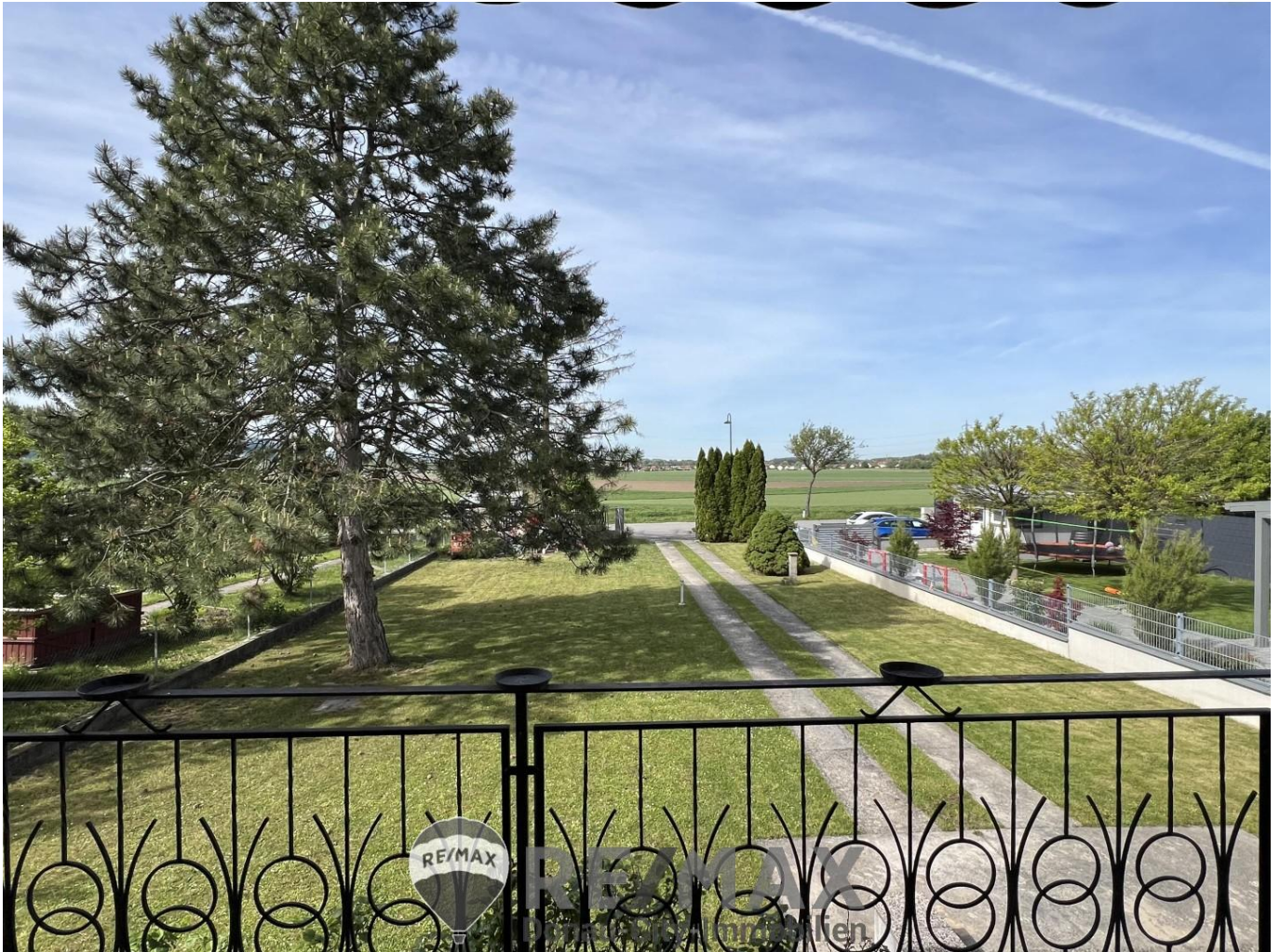
01 Einfamilienhaus in Unterrohrbach