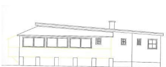
NORD - OST