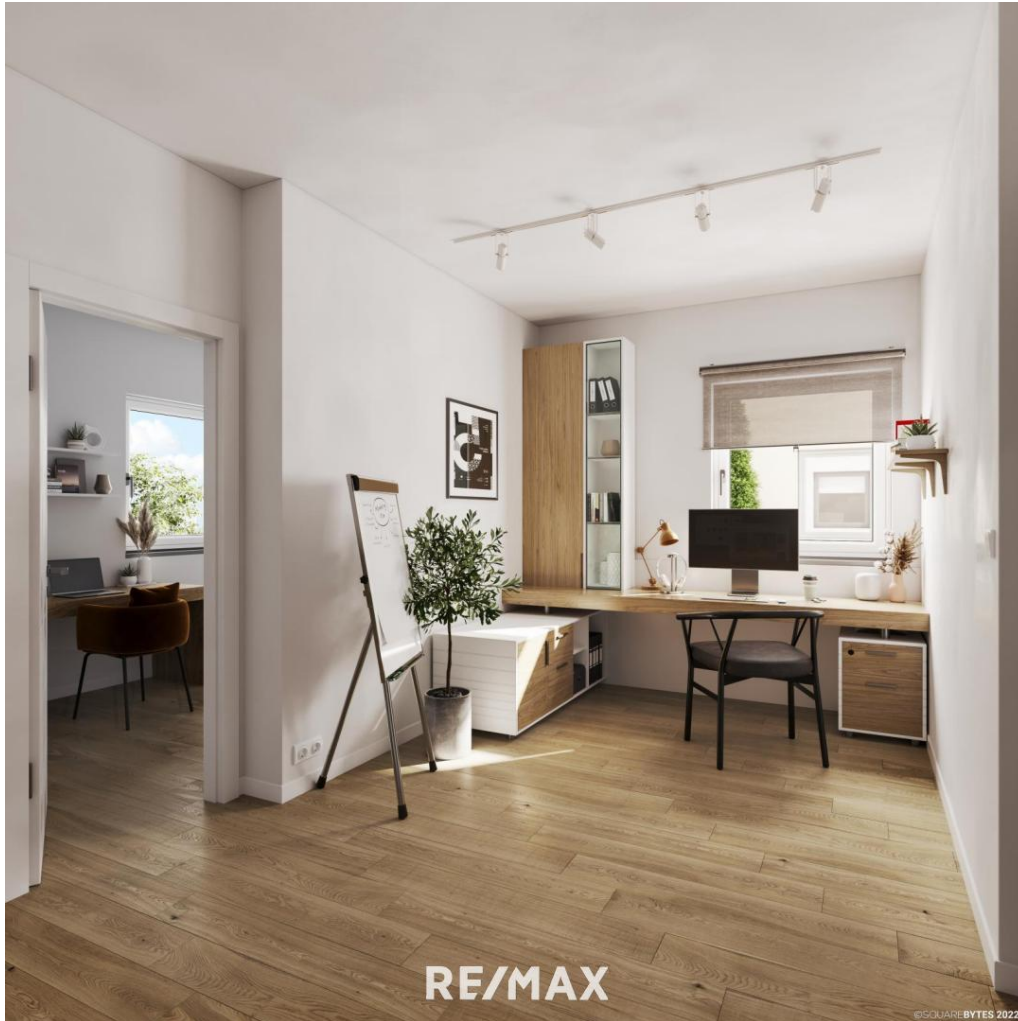
Büro OG (Rendering)