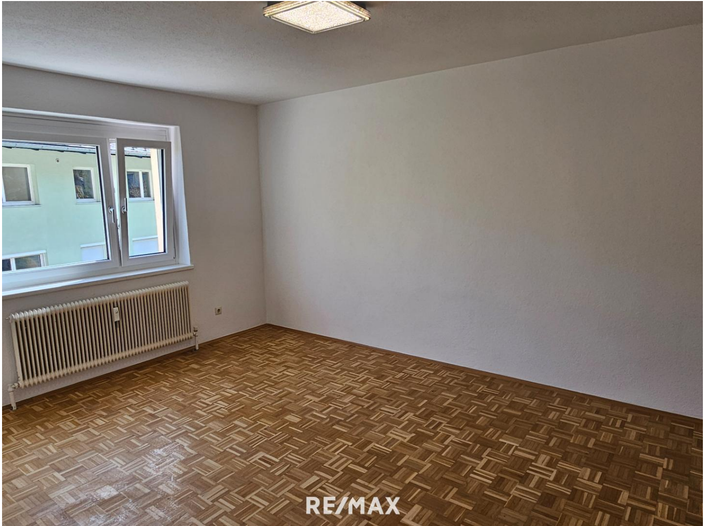
Wohnzimmer / living room

Wohnen, wo der See nur einen Spaziergang entfernt ist!