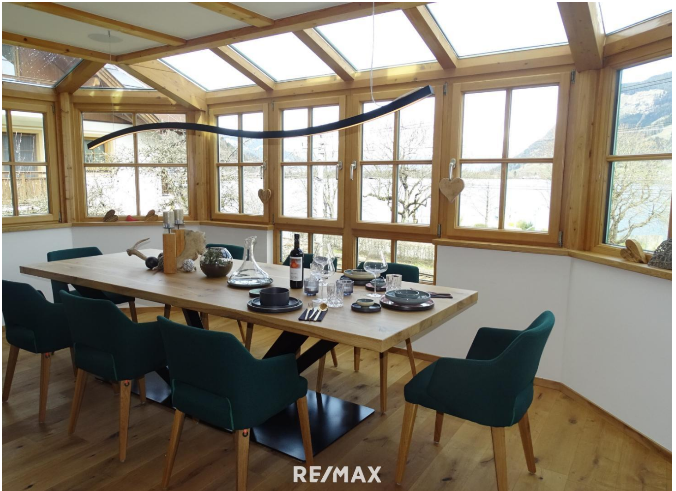
Essbereich/ dining area

Ihre neue VIP Adresse direkt im Zentrum von Zell am See - Touristische Vermietung möglich!