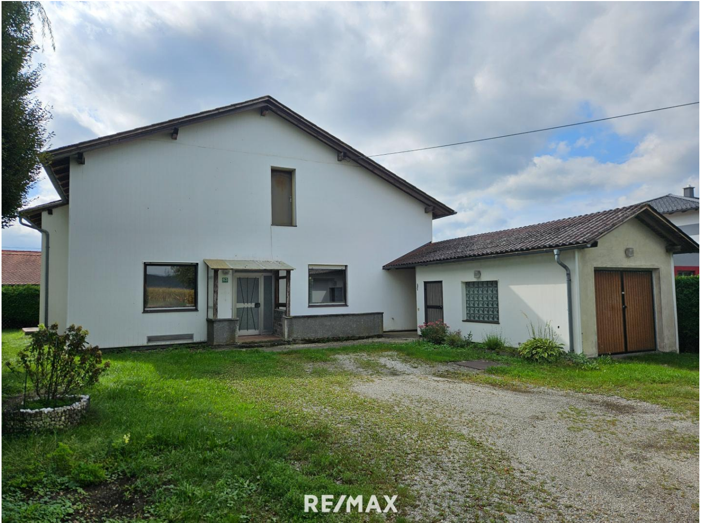
Haus in Ranshofen bei Braunau