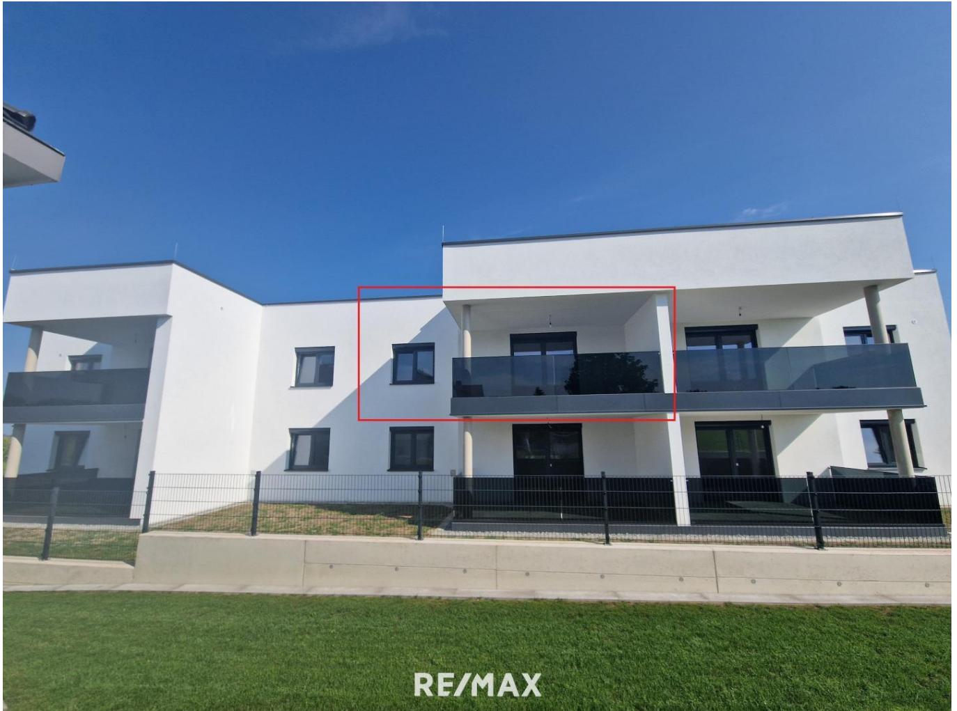
Titelbild TOP 5