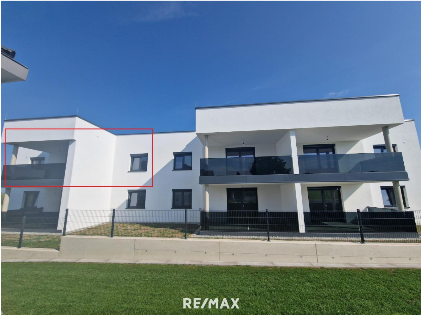
Titelbild TOP 4