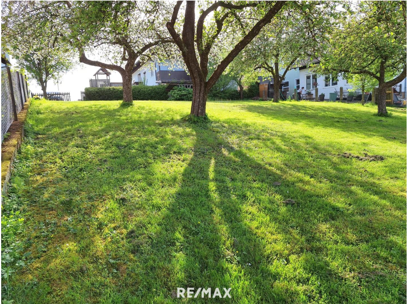
Blick vom Baugrundende auf das Einfahrtstor