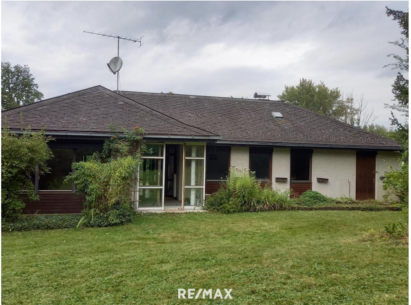
RE/MAX Ansicht Süd Ost