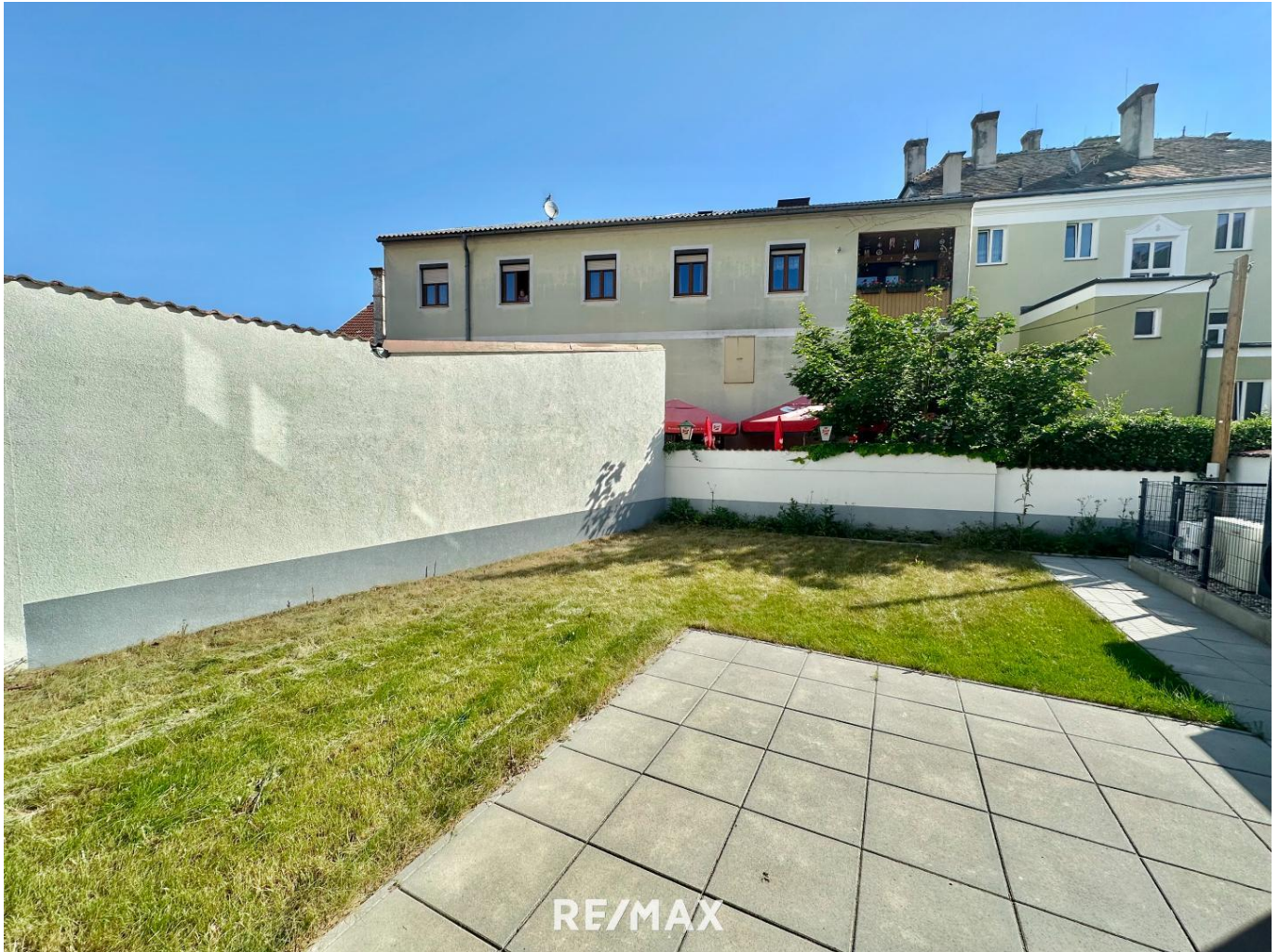
Garten mit Terrasse