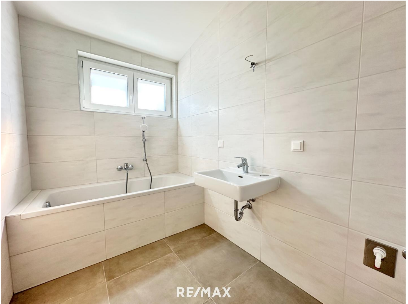
zweites Badezimmer im OG