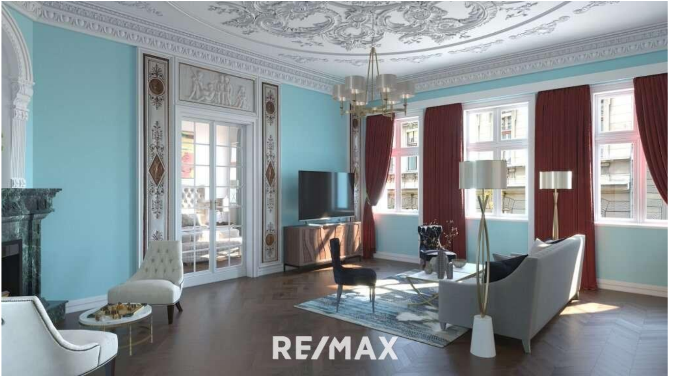
Bild 1 Wohnung 1070 Wien