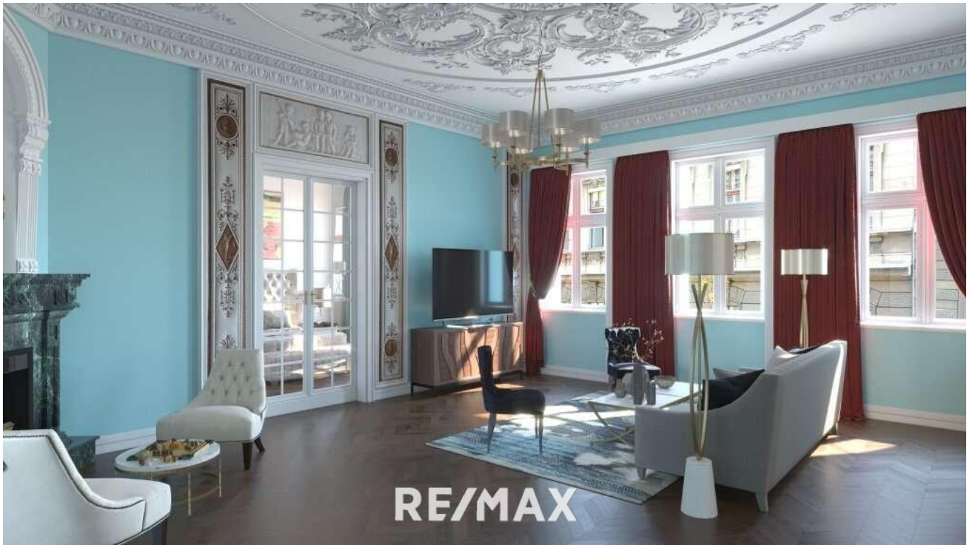
Bild 1 Wohnung 1070 Wien