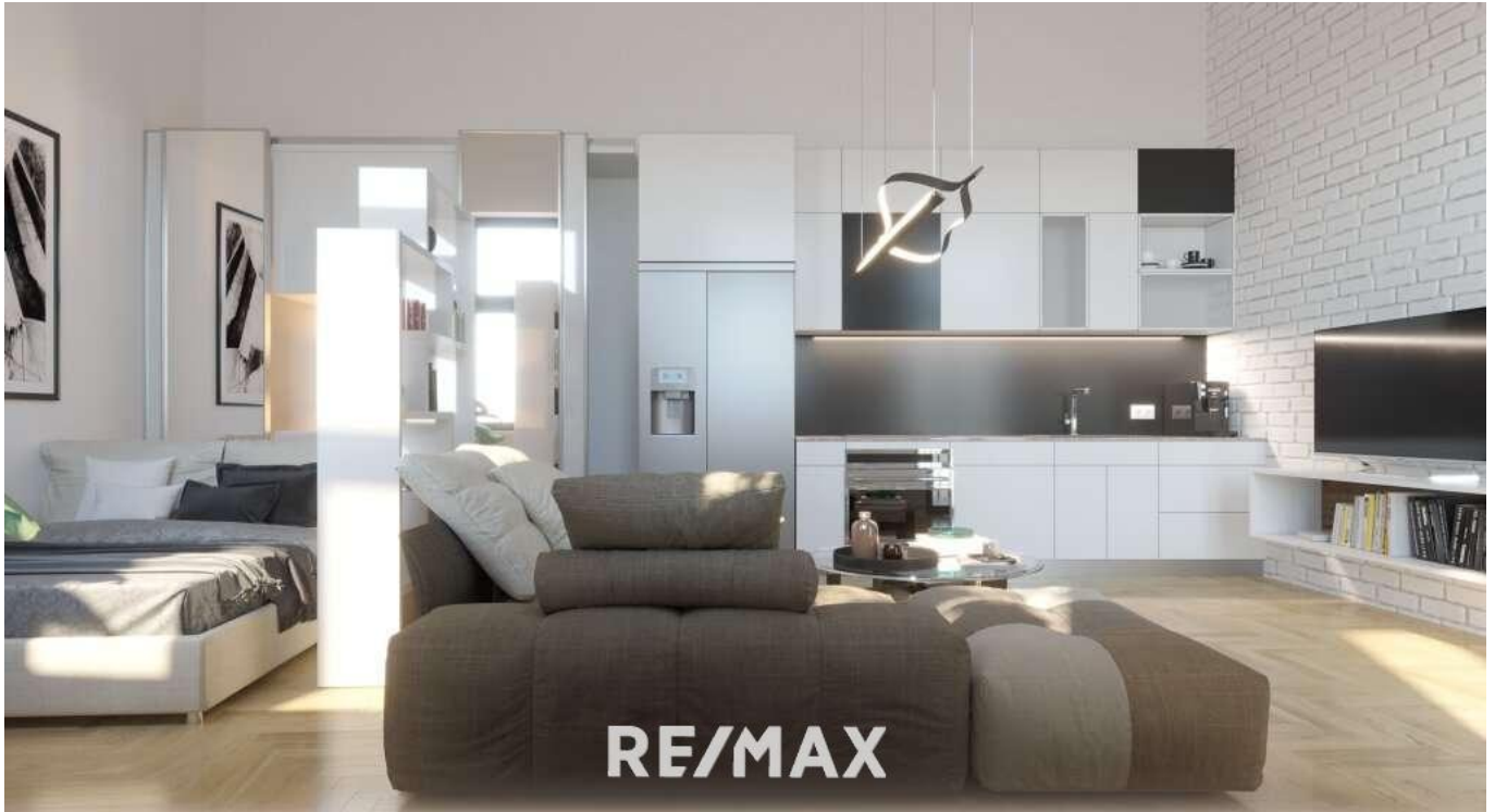
Bild 1 Wohnung 1070 Wien