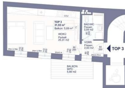
Übersichtsplan: 1. OG