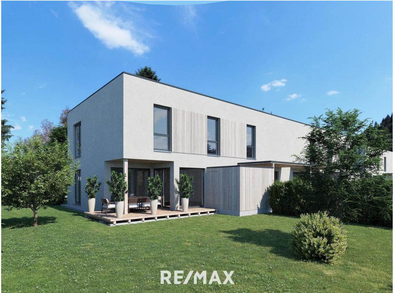
Haus 4 A