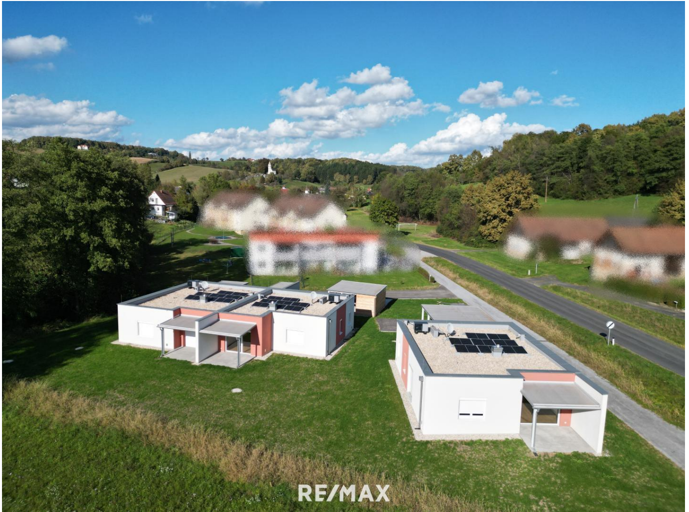
Bungalow 1 + 2 + 3