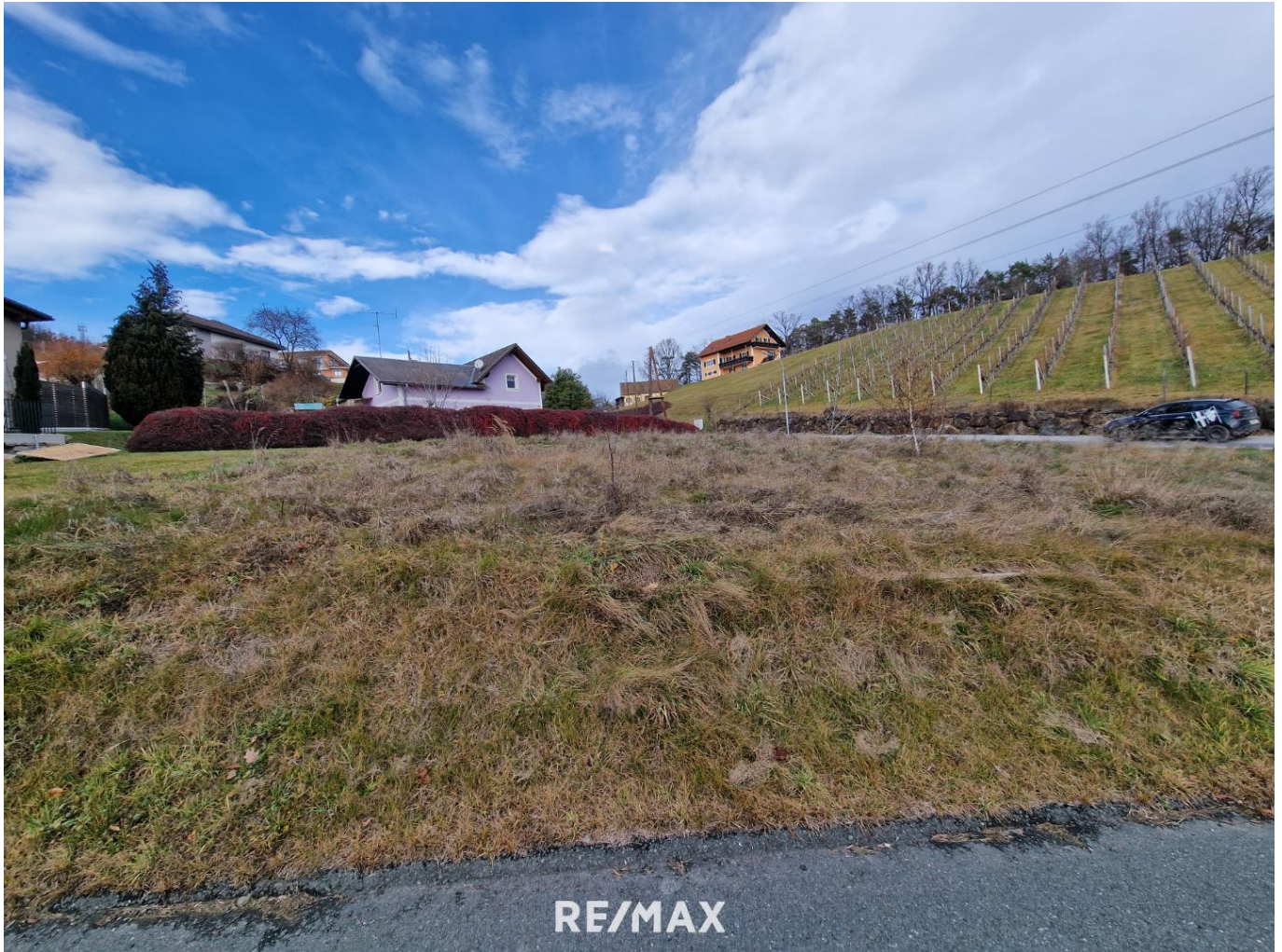
Grundstück Sicht auf Weingärten