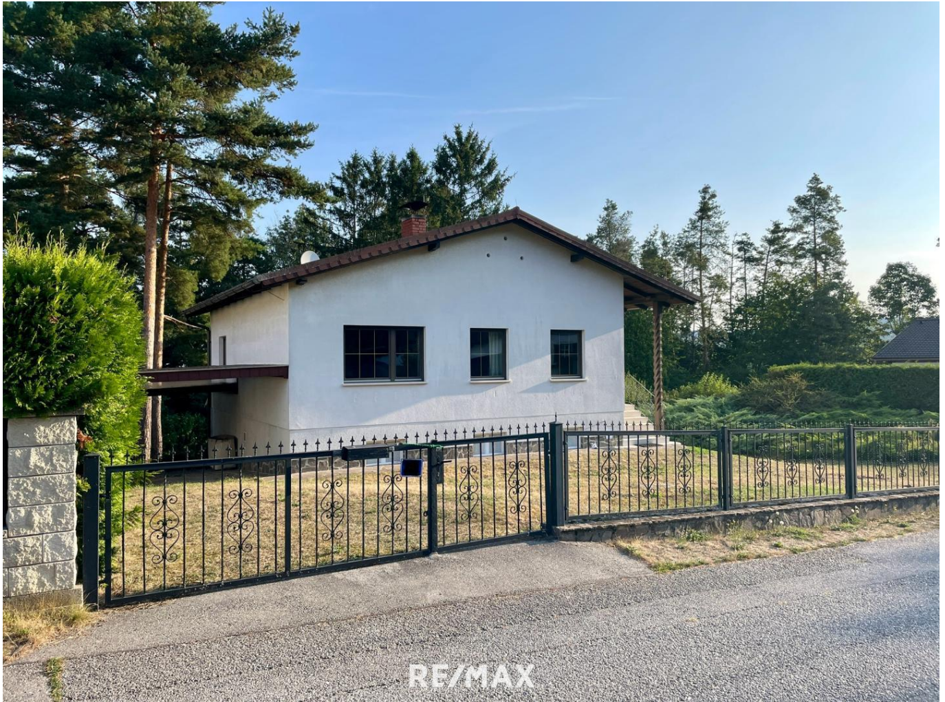
1. Haus von außen