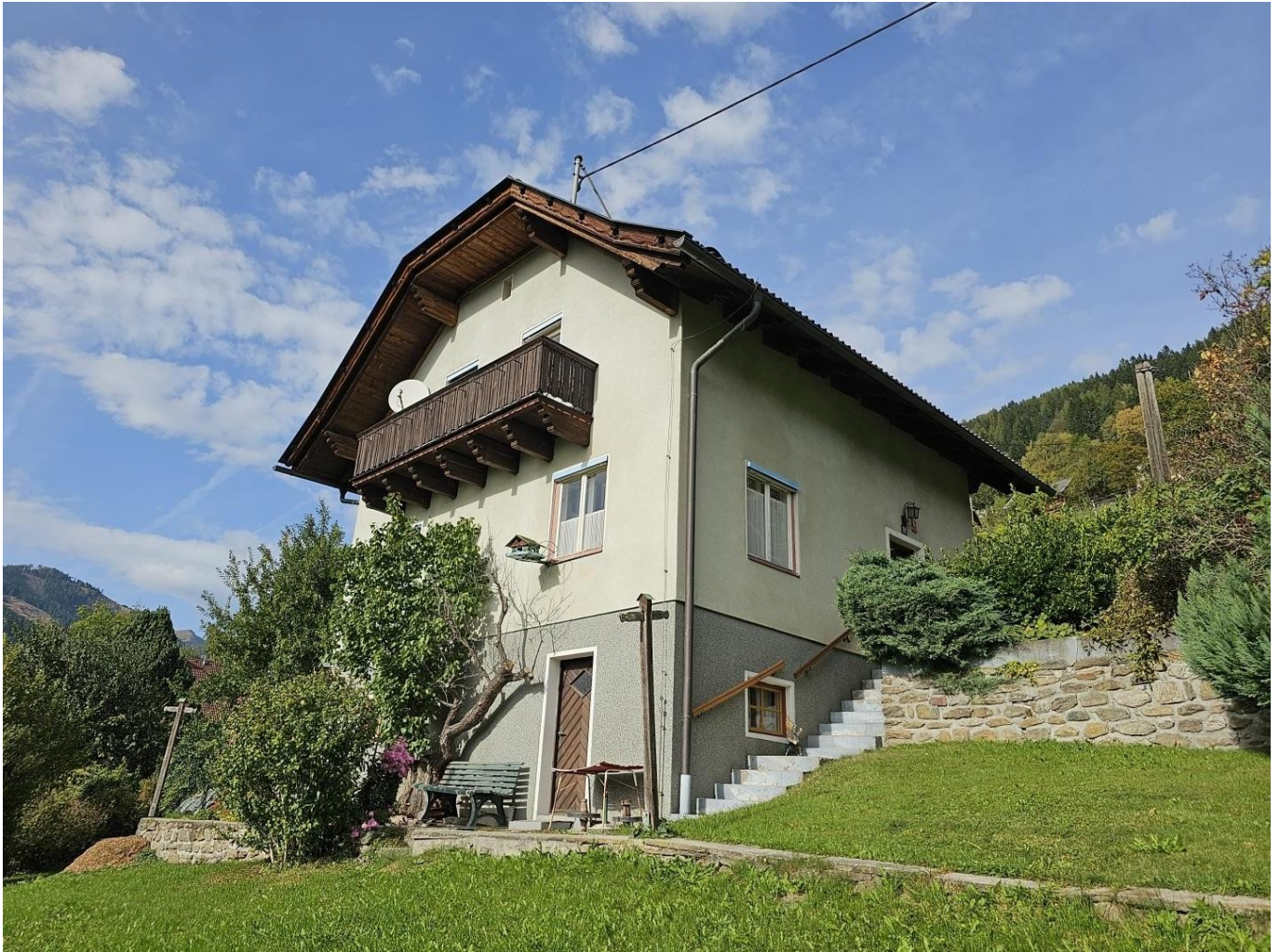
das Haus im Grünen