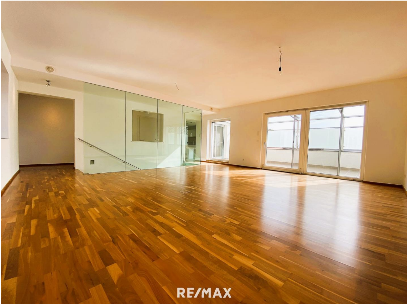
RE/MAX 5 Wohnzimmer B2