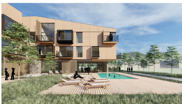
3 Visualisierung 3.5 Visualisierung

Der Inhalt dieser Präsentation ist geistiges Eigentum der RE/MAX Real Estate Group und darf ohne schriftliche Genehmigung nicht an Dritte weitergegeben werden. KONZEPTDESIGN/Doppel Apartments_Kieszbirg3, September 2021 Viereck