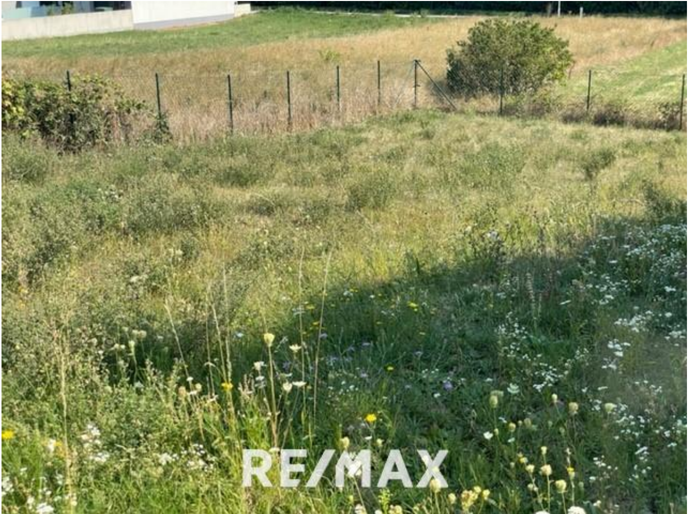
Grundstück in Neusiedl am See