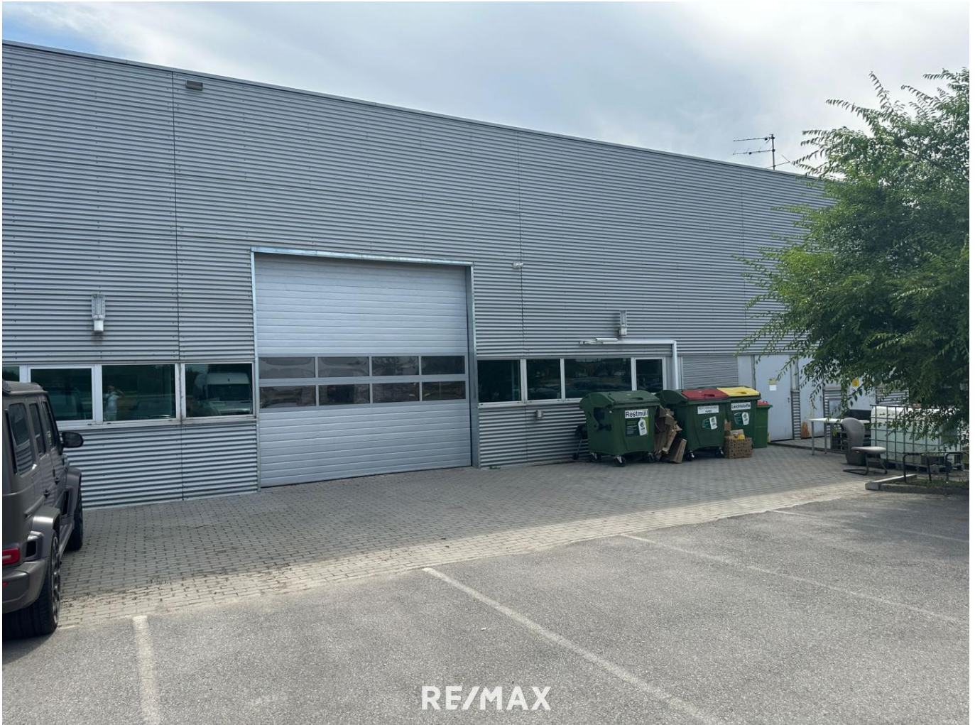
Werkstätte Parndorf Zugang/-fahrt