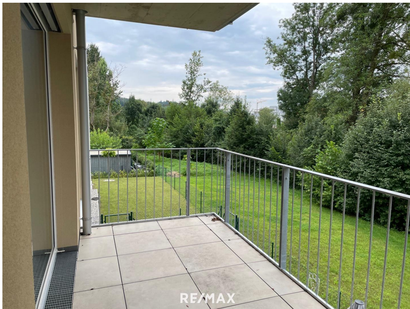
Balkon links Ausblick ins Grüne

Für Anleger - NEU und schon VERMIETET - provisionsfrei!