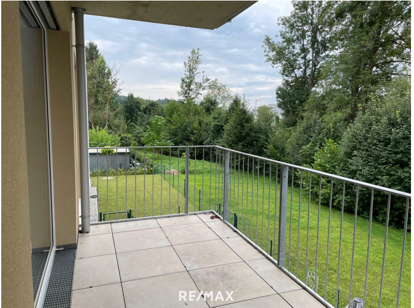
Balkon links Ausblick ins Grüne

Für Anleger - NEU und schon VERMIETET! - 70m 2 mit großem Balkon in sonniger Lage - provisionsfrei !