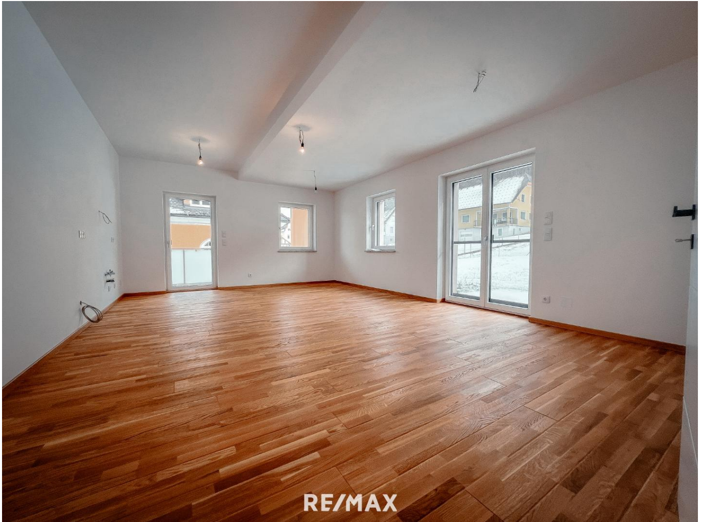
Zimmer 1 (Wohnraum_Küche) Top 2