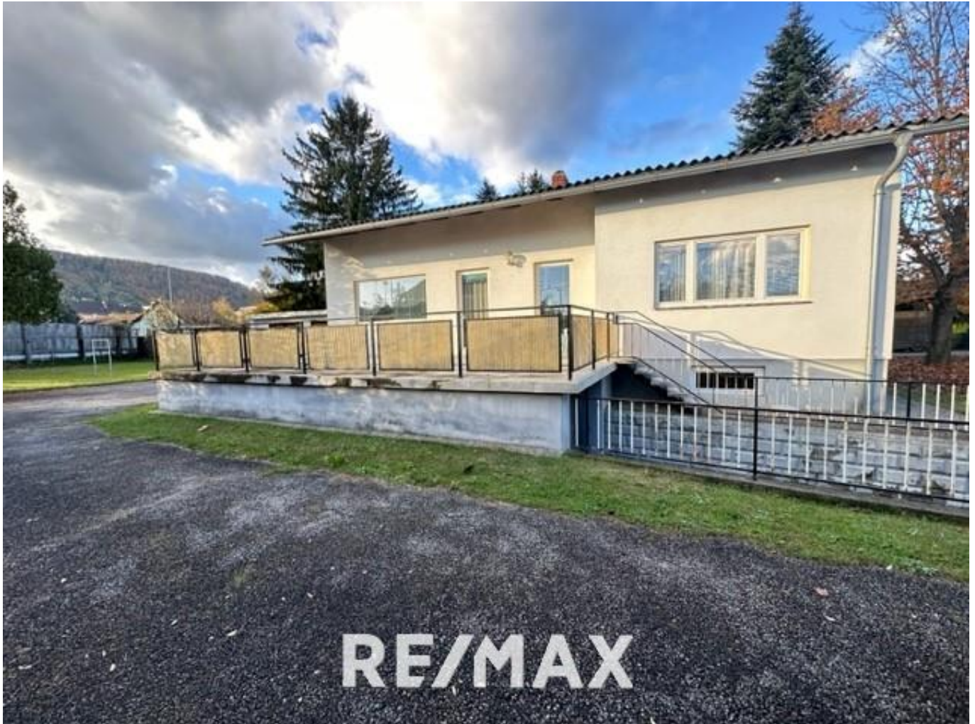
Ansicht Haus 1