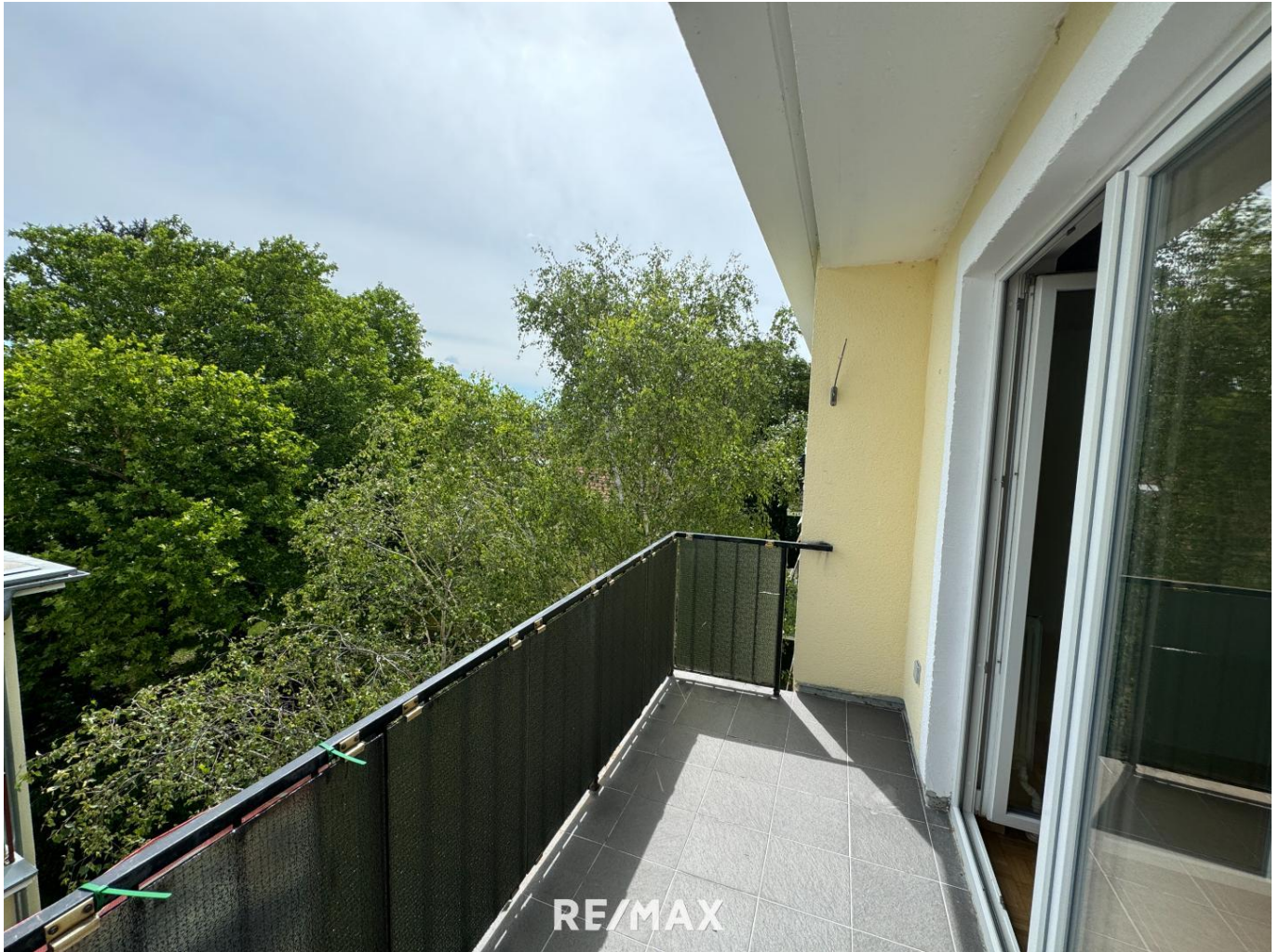
3. Balkon mit Blick ins Grüne