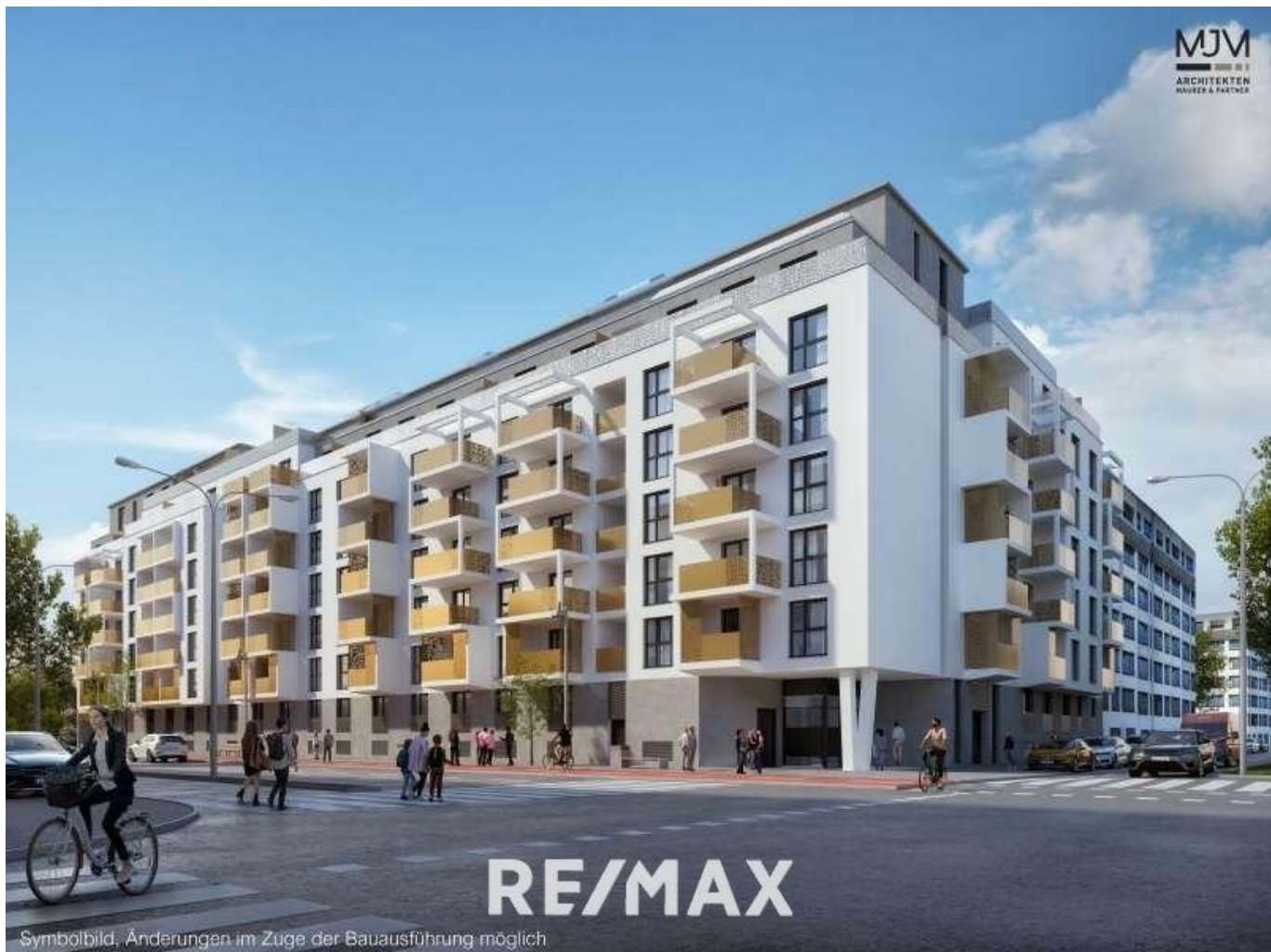
Symbölbild, Änderungen im Zuge der Bauausführung möglich

FÜR DEN KÄUFER VERKÄUFER ZAHLT KÄUFERPROVISION PROVISIONSFREI