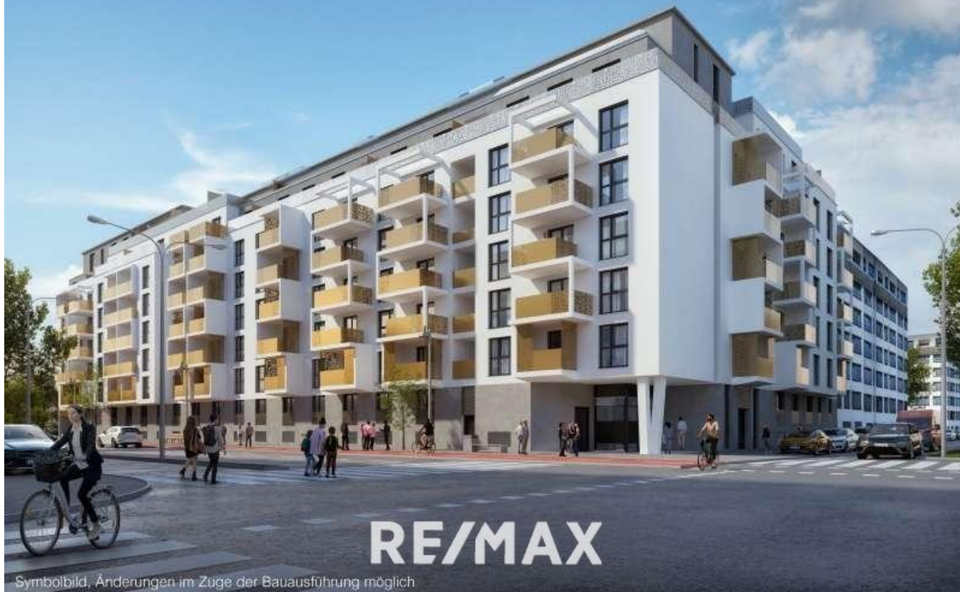
Symbölbild, Änderungen im Zuge der Bauausführung möglich

FÜR DEN KÄUFER VERKÄUFER ZAHLT KÄUFERPROVISION PROVISIONSFREI RE/MAX