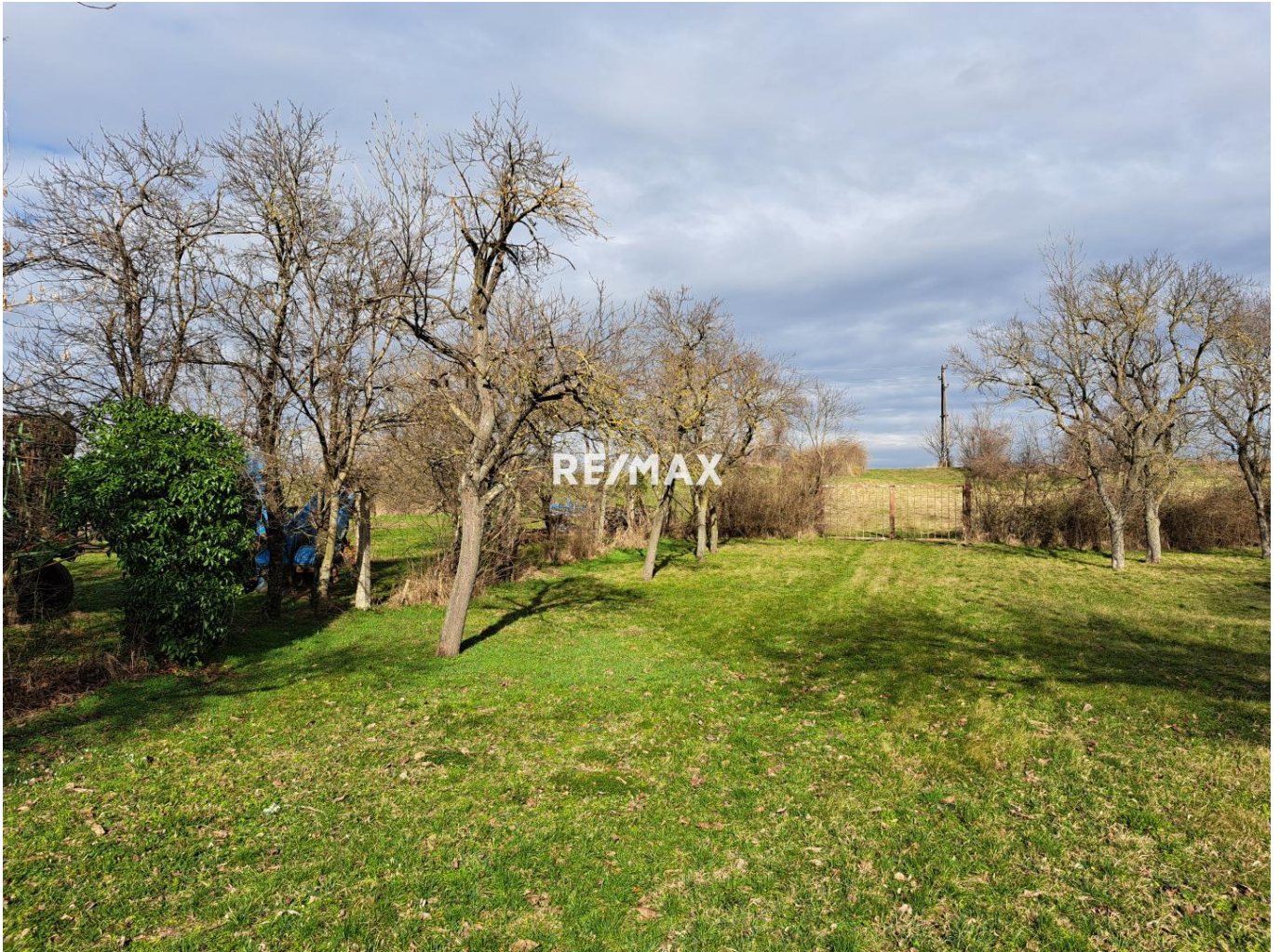
Garten mit Obstbäumen

Objektnummer: 2434_1923 Eine Immobilie von RE/MAX Vital