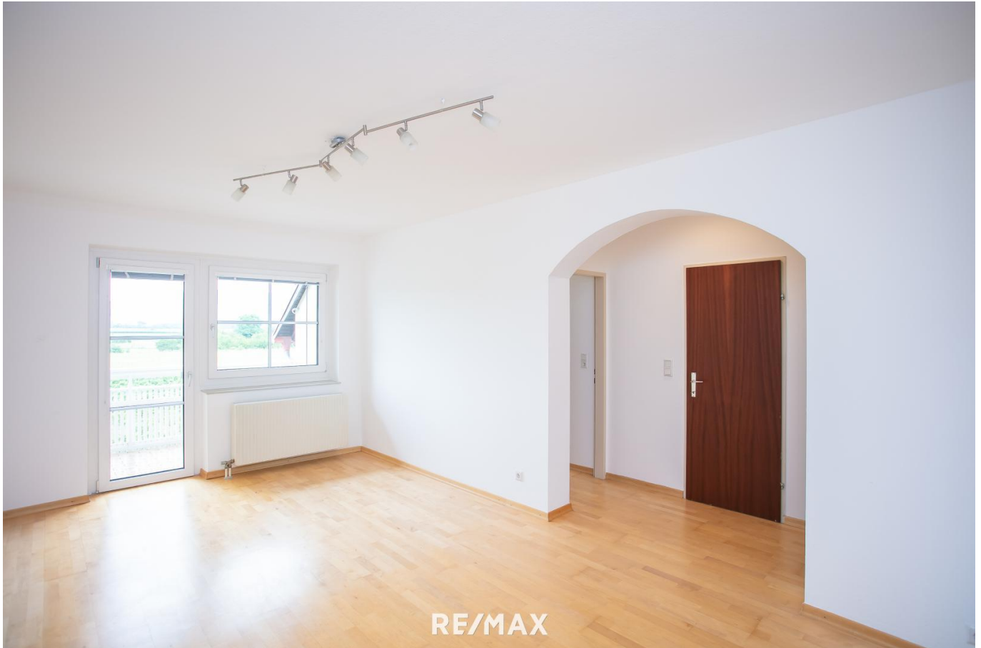
Wohnzimmer Ansicht 1