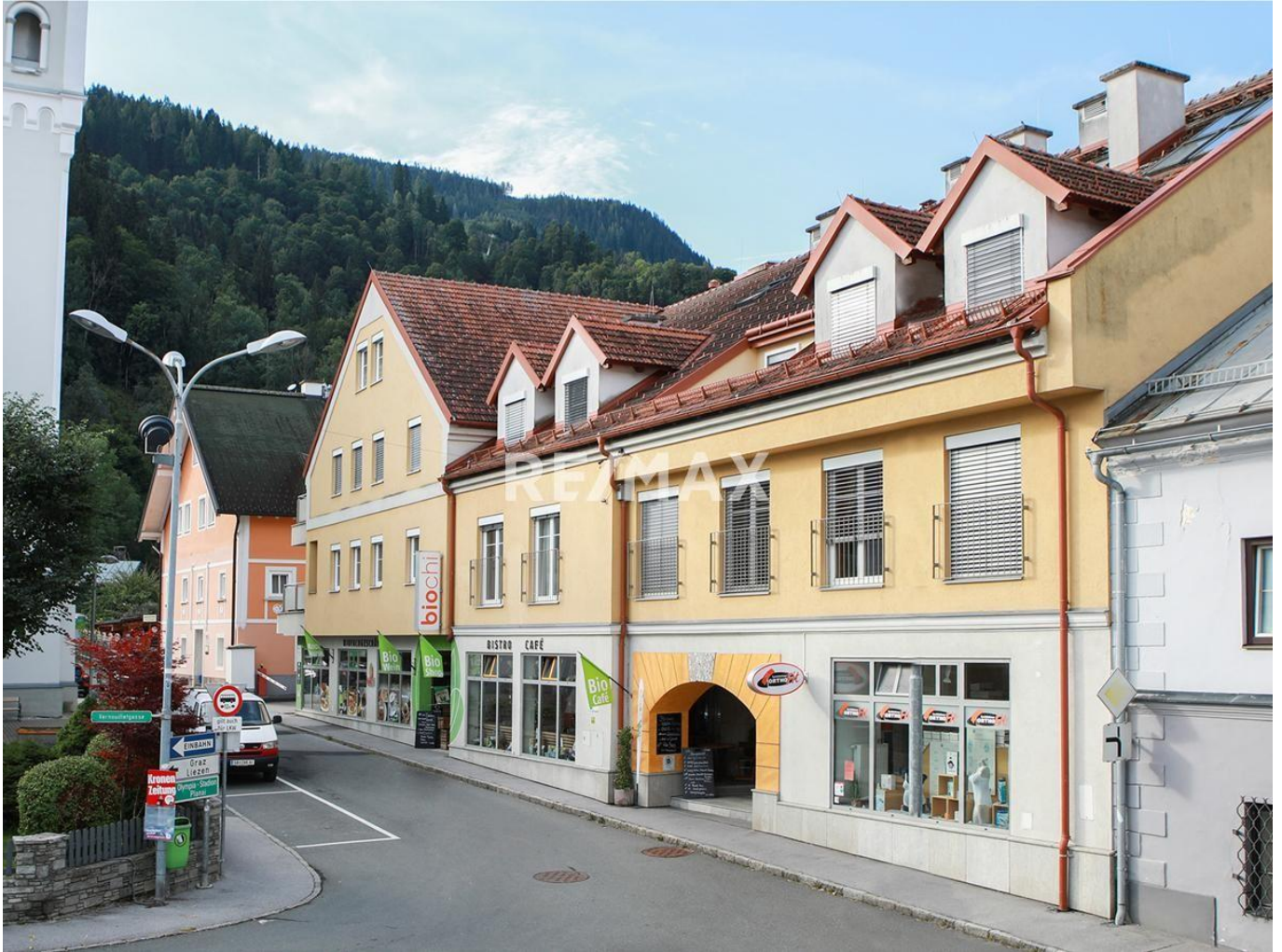
a Eingang Geschäftslokale