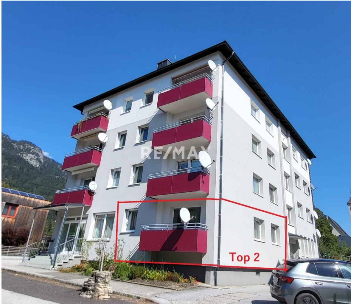
Wohnung Top 2